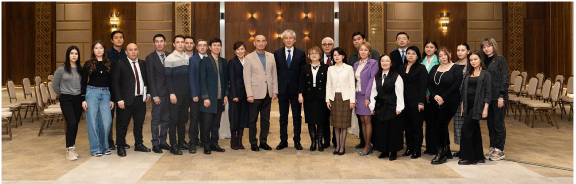
Участники Республиканского круглого стола, приуроченный ко Всемирному дню выборов. Maqsut Narikbayev University. 2024 г.